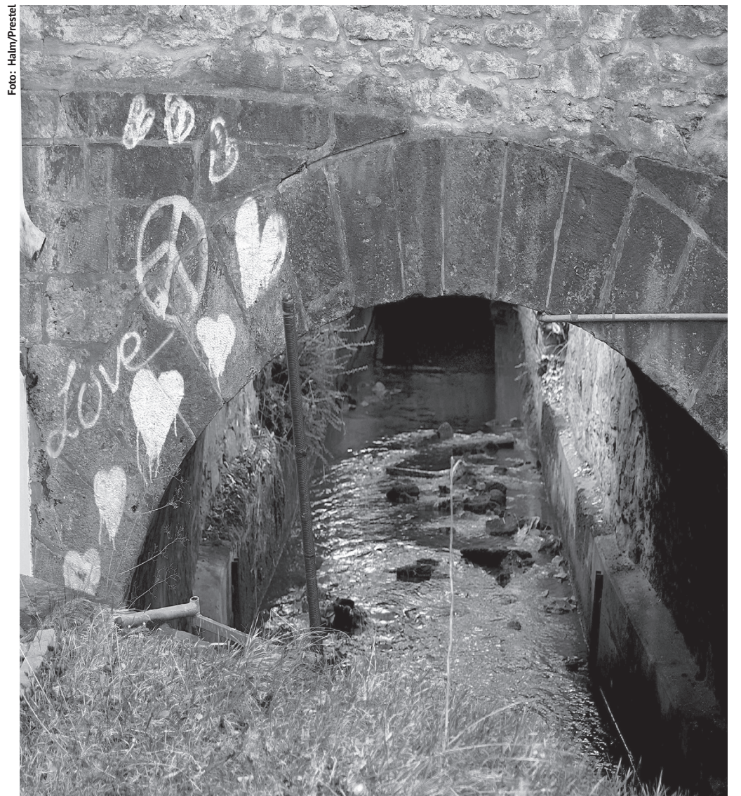
Die Lutter im Februar 2026 in der Altstadt.

Lutterwasser kam nicht mehr im alten Umfang in der Stadt an, weil es in eine neu errichtete Wasserleitung zum Bielefelder Bahnhof eingeleitet wurde. Die Bahngesellschaft zapfte Wasser ab, um damit die Kessel der Lokomotiven zu füllen.